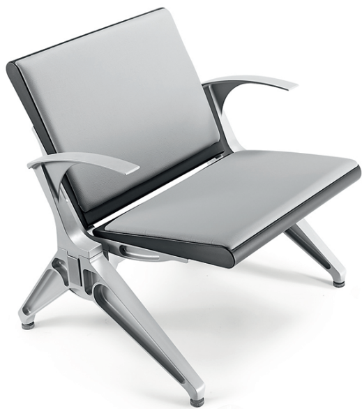
Foto meramente ilustrativa, kit sem tapeçaria.

T-Air é uma longarina moderna, robusta e personalizada que se adapta a necessidade de cada cliente.