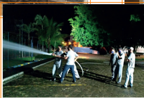
● Treinamento Brigada de Emergência