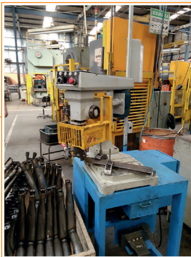
Reforma Furadeira Estamparia ●