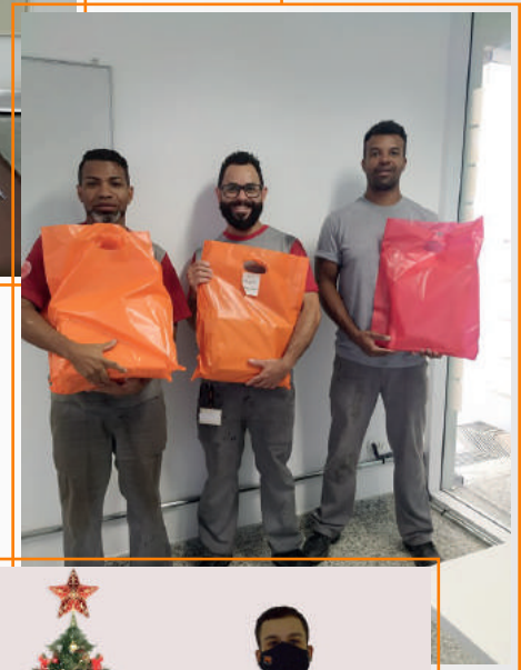
Kit Escolar Filial