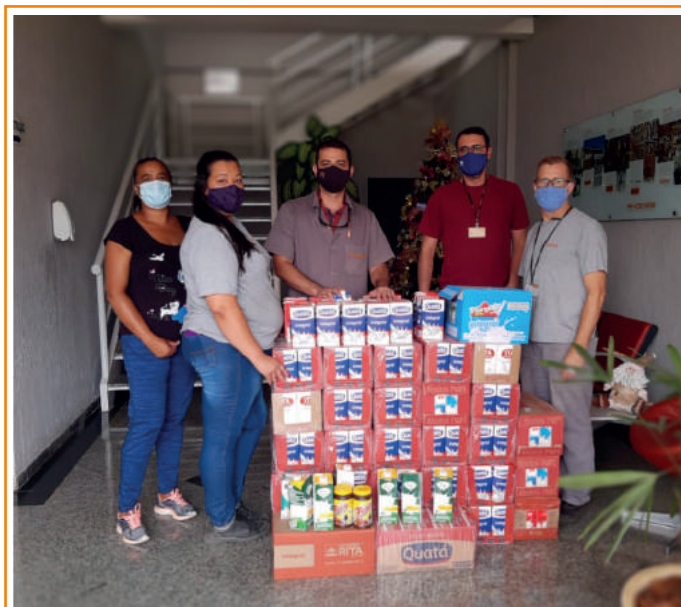
Doação de Leite

Atendendo a um pedido da Casa da Criança de Cambuí, foi realizada a Campanha de Doação de Leite, onde os colaboradores contribuíram com 441 litros e a empresa dobrou essa quantidade em 882 litros, perfazendo um total de 1.323 litros de leite.