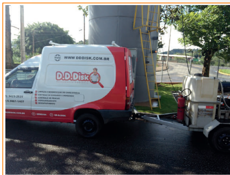
Higienização e Limpeza dos Reservatórios

É importante destacar que a Rhodes mantém, em ambas as unidades, o controle de análise da potabilidade da água consumida.