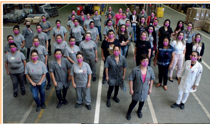
● Outubro Rosa