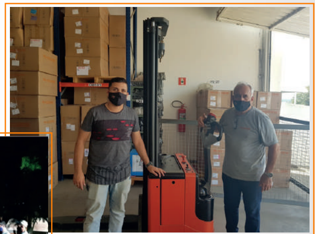
● Treinamento CD's