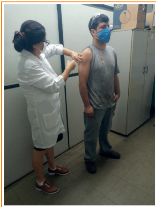
● Campanha Sarampo

Em 2020, a Rhodes preocupou-se com a saúde e bem-estar de seus colaboradores de forma muito intensa. Além de todos os cuidados com a Covid-19, também foi realizada a vacinação contra o sarampo, em seus colaboradores na faixa etária de 20 a 49 anos, seguindo as recomendações do Ministério da Saúde.