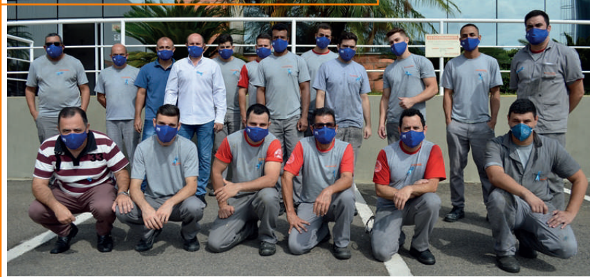
Novembro Azul ●