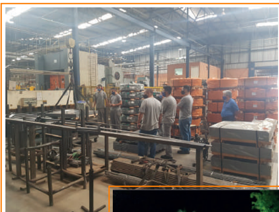
● Treinamento Ponte Rolante

Em 2020, foram investidos R$ 106.664,00 na área de Segurança do Trabalho, assim como foram dedicadas 477 horas/treinamento.